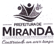
FÁBIO SANTOS FLORENÇA PREFEITO MUNICIPAL